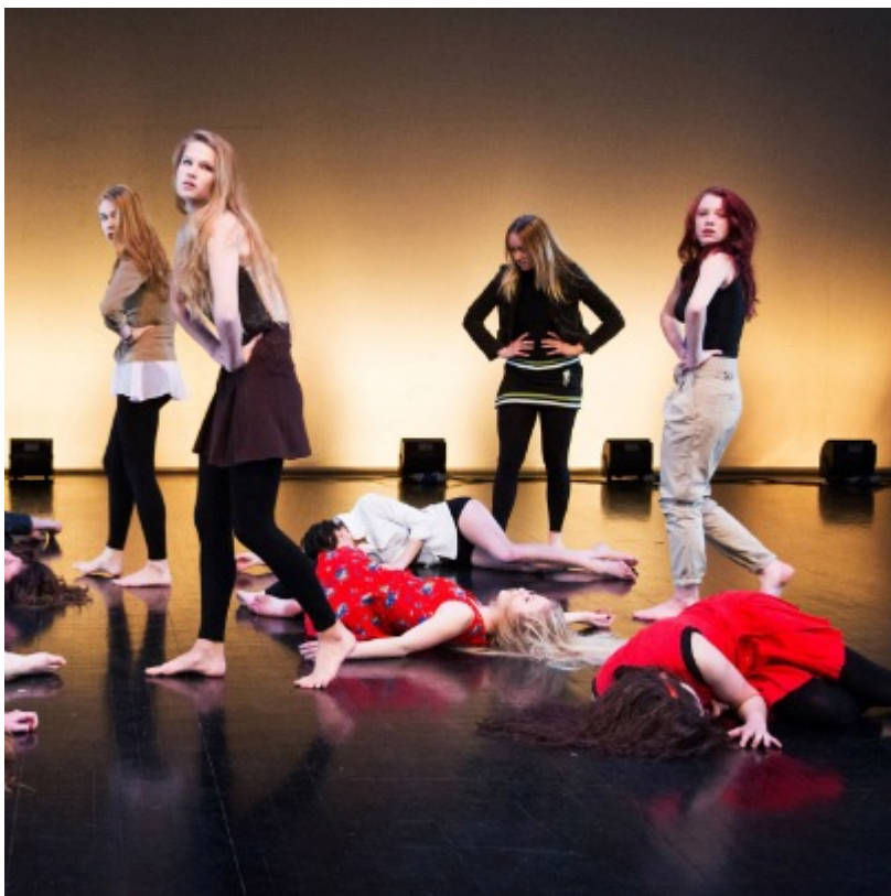
Lastna soba 3,4