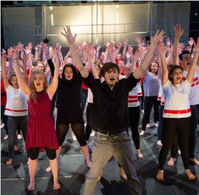
predstava Lastna soba 1,2 nagrajena za najboljšo uprizoritev Transgeneracij...